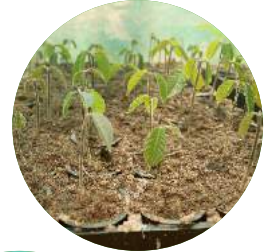
Guarea guidonia Requia