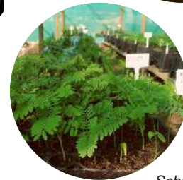
Schizolobium parahyba Pinochuncho