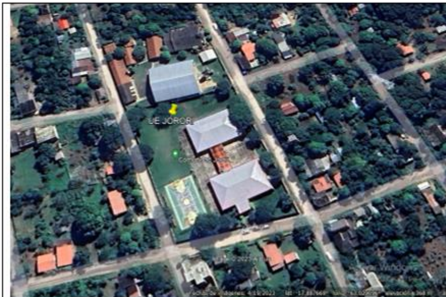
Unidad Educativa Aponte de Jorory

Coordenadas: Latitud -17.887360° Longitud 63.029005°