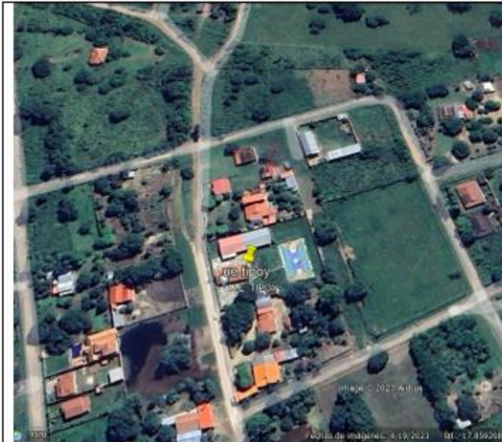
Unidad Educativa Tipoy

Coordenadas: Latitud -17.858900° Longitud -63.026994°