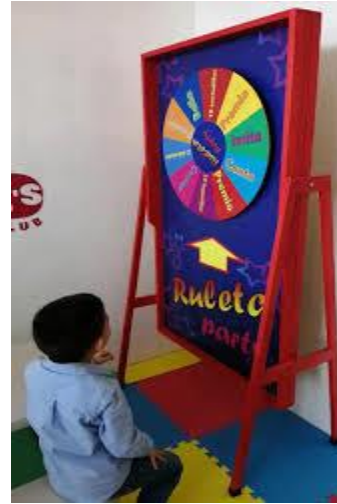
FIGURA N°2 RULETA GRANDE