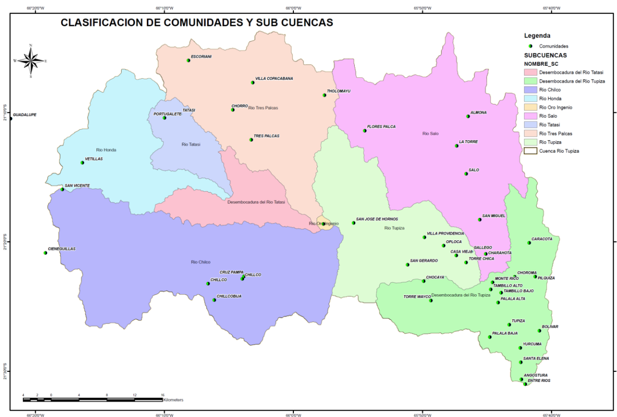
Figura 2: Mapa de Clasificación de Comunidades y Subcuencas