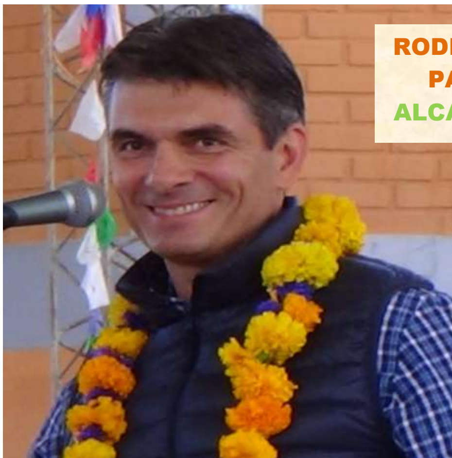
RODRIGO PAZ ALCALDE

Programa de Gobierno Municipal Gestión 2015 – 2020