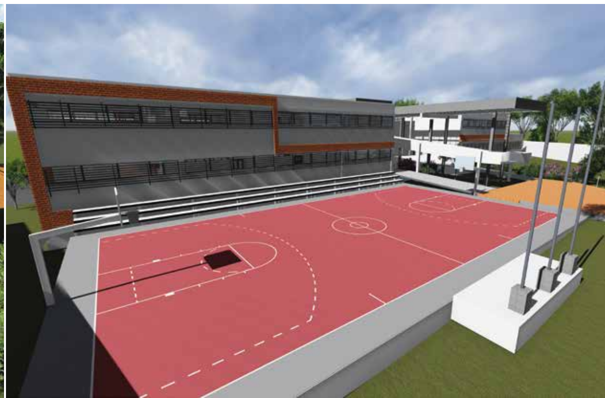
U. E. SALVADOR