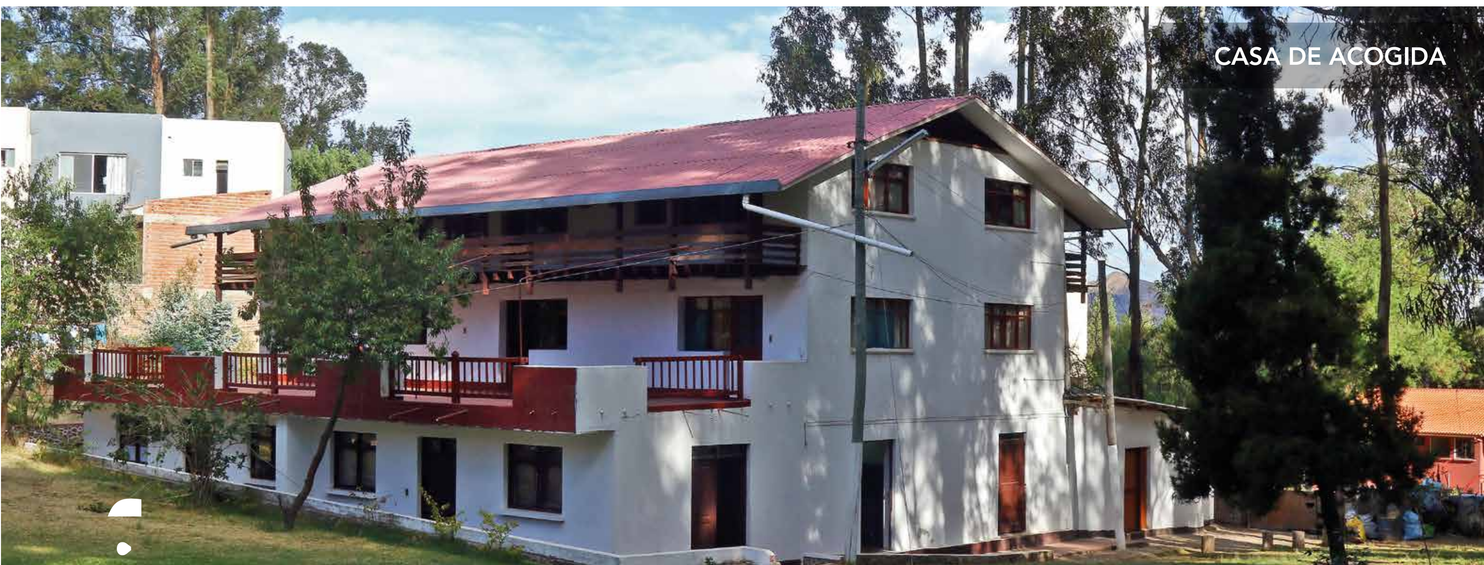
CASA DE ACOGIDA