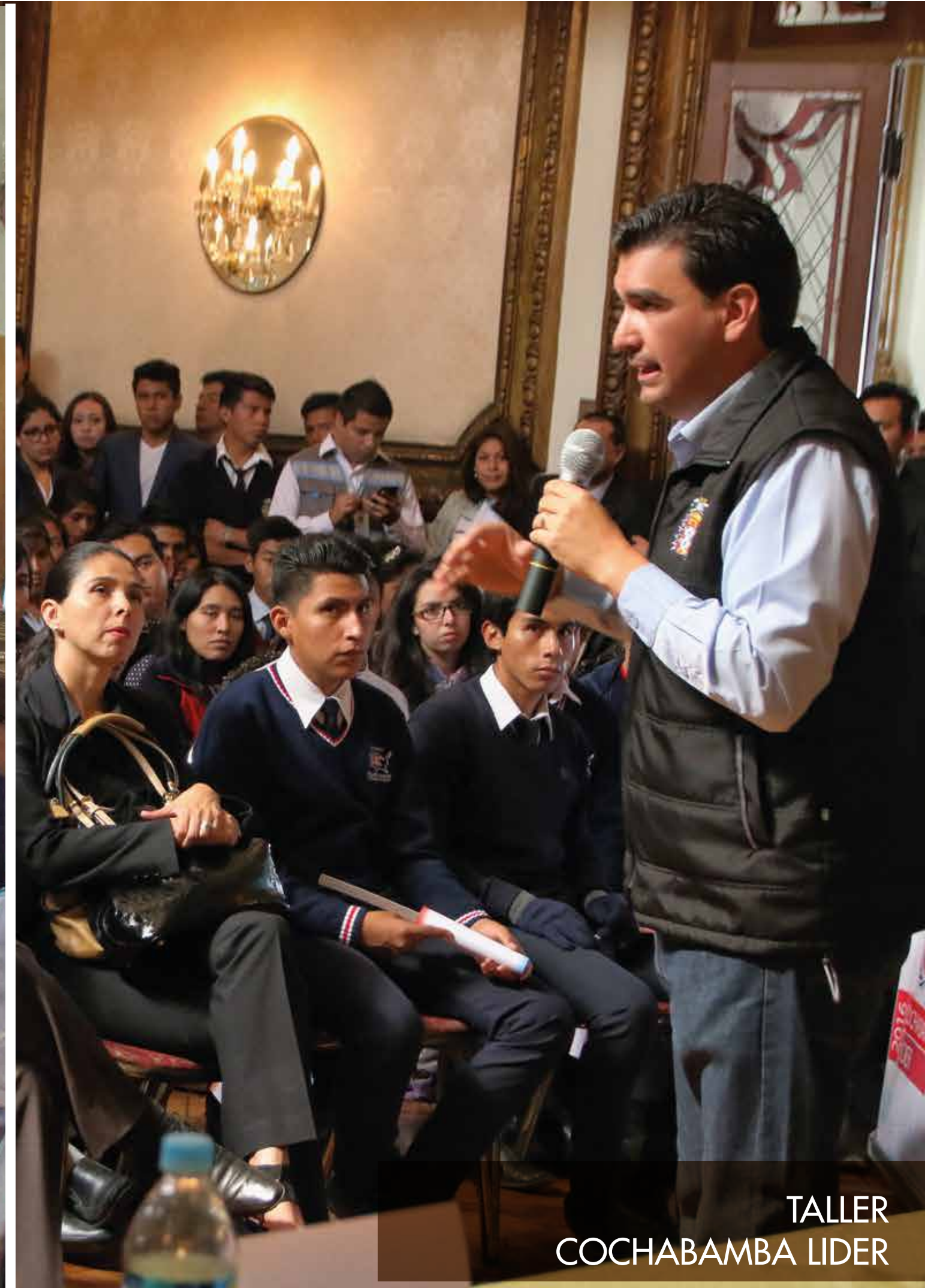
TALLER COCHABAMBA LIDER