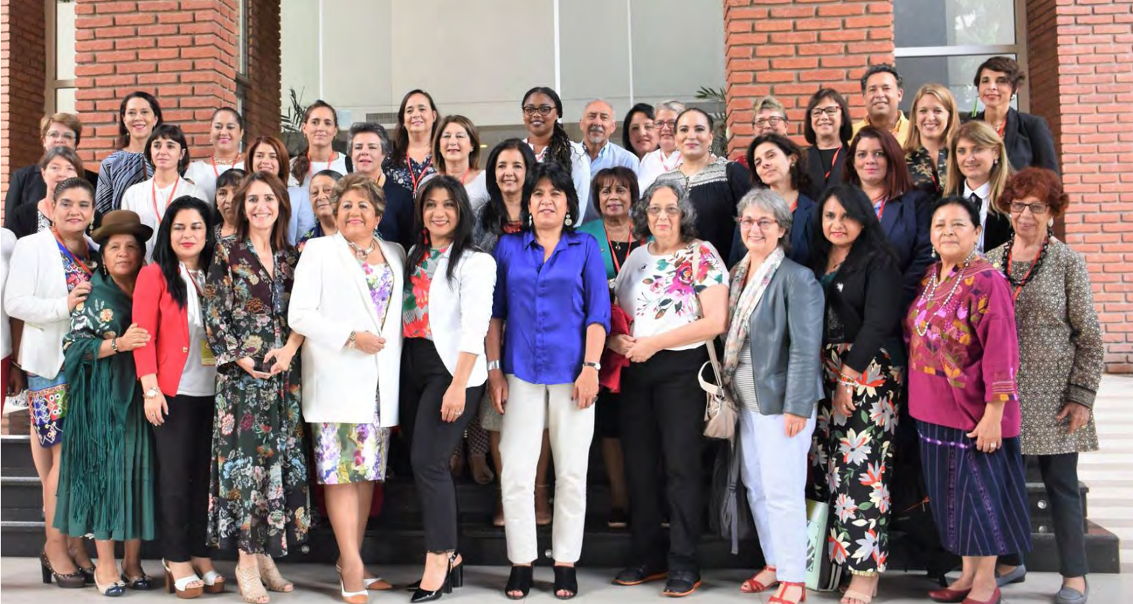
Participantes de la II Conferencia de la Asociación de Magistradas Electorales de las Américas (AMEA)