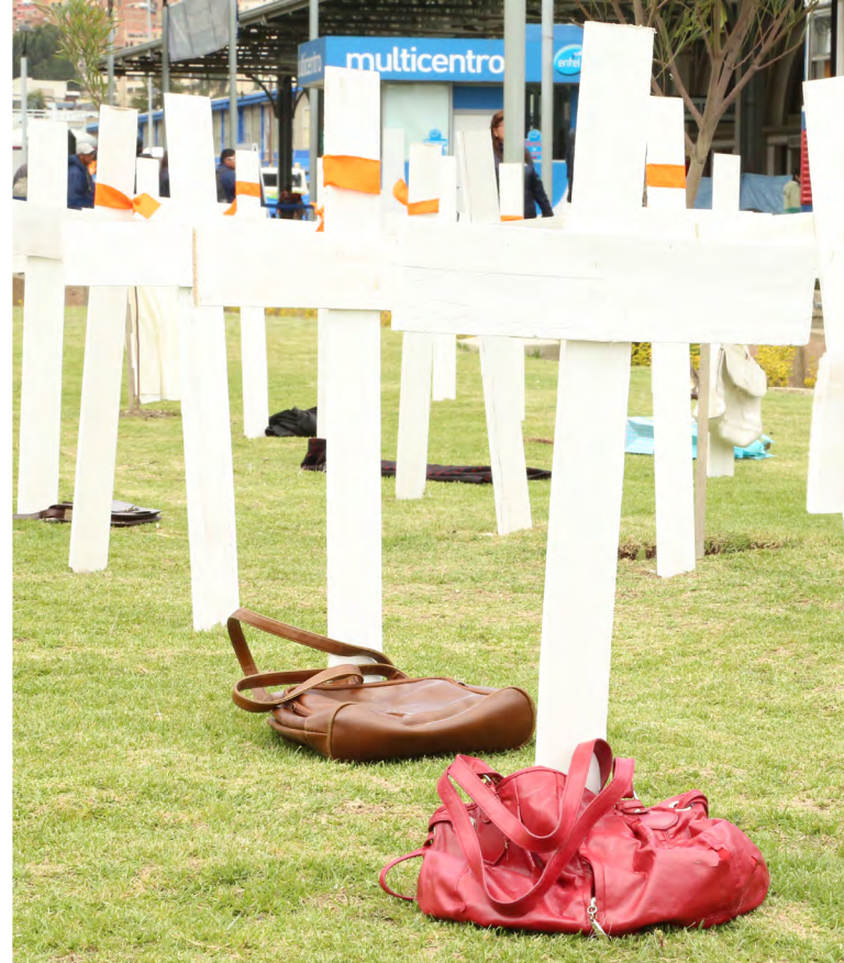
Homenaje póstumo a las víctimas de feminicidio en el marco de la campaña ÚNETE 25 de noviembre 2018