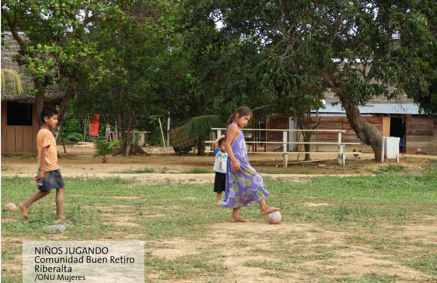
NIÑOS JUGANDO Comunidad Buen Retiro Riberalta /ONU Mujeres