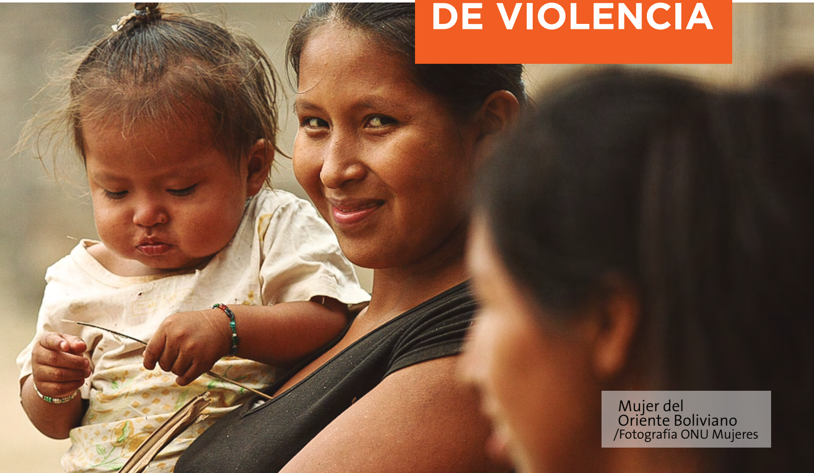
Mujer del Oriente Boliviano

El derecho de las mujeres a vivir sin violencia está consagrado en acuerdos internacionales como la Convención sobre la Eliminación de Todas las Formas de Discriminación Contra la Mujer (CEDAW). A nivel global, ONU Mujeres trabaja con los países para avanzar en el cumplimiento de los marcos normativos internacionales, prestando apoyo a procesos intergubernamentales.