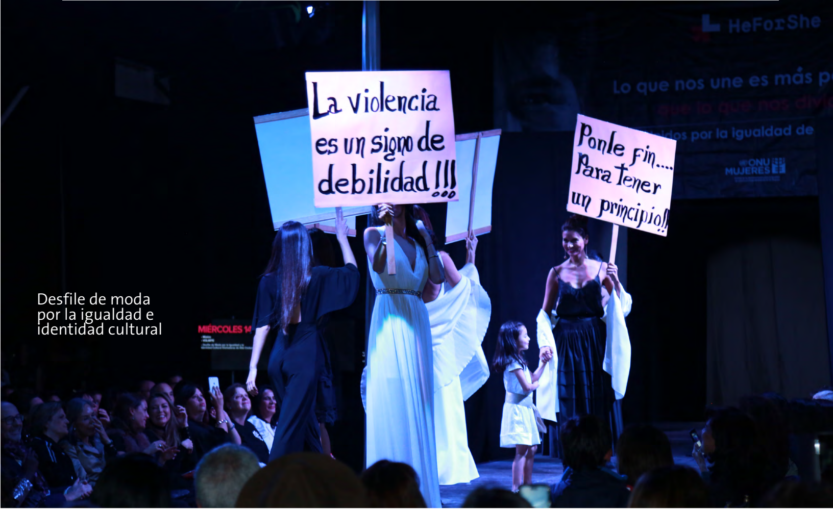
Desfile de moda por la igualdad e identidad cultural