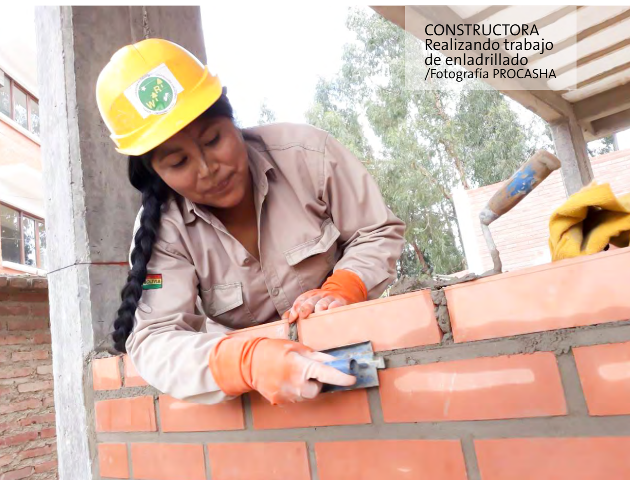
CONSTRUCTORA Realizando trabajo de enladrillado

El acceso de las mujeres a la tierra y los recursos productivos para una agricultura resiliente al cambio climático