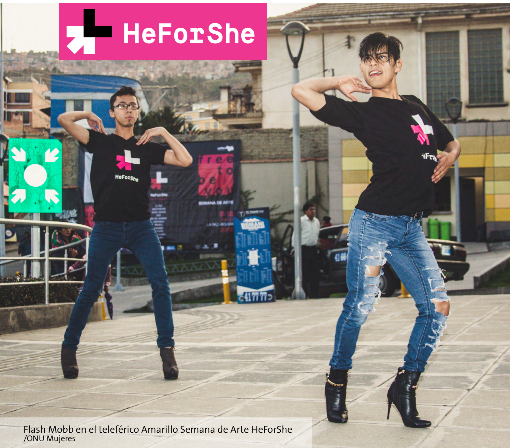
Flash Mobb en el teleférico Amarillo Semana de Arte HeForShe /ONU Mujeres