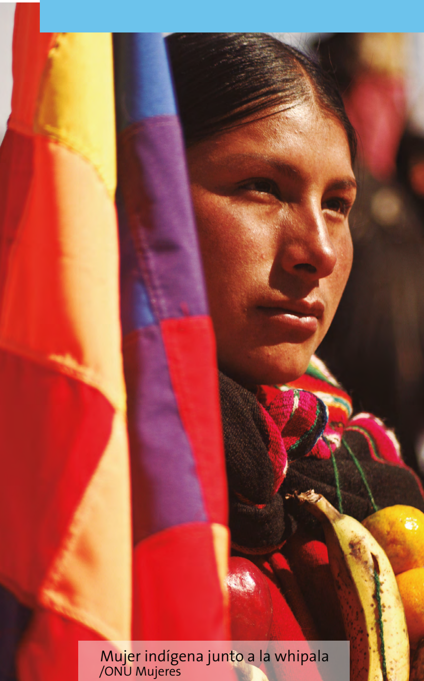
Mujer indígena junto a la whipala

ONU Mujeres trabaja para lograr la incorporación de la igualdad de género de forma transversal en la agenda nacional de desarrollo. Con este objetivo, se coordina con el Comité de la CEDAW (Convención sobre la Eliminación de Todas las Formas de Discriminación contra la Mujer) y con todas las instancias relativas a los compromisos intergubernamentales suscritos por el Estado Plurinacional de Bolivia y Foros Internacionales tales como la Plataforma de Acción de Beijing y la Comisión de la Condición Jurídica y Social de la Mujer de las Naciones Unidas (CSW), promoviendo que Bolivia participe, implemente las recomendaciones y reporte sobre los avances en materia de igualdad de género y empoderamiento de las mujeres.