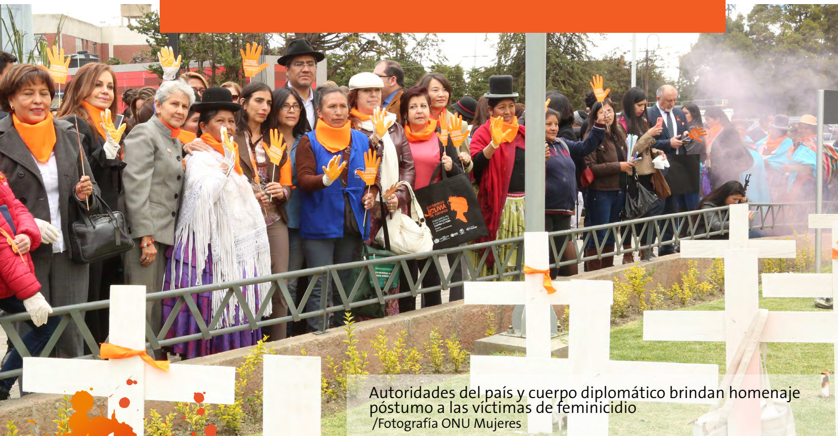
Autoridades del país y cuerpo diplomático brindan homenaje póstumo a las víctimas de feminicidio