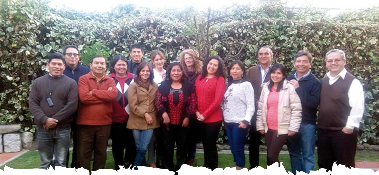
1ra Reunión de Socialización e Información de Proyectos apoyados por CEPF – Portafolio Bolivia - La Paz, 12 de agosto del 2016