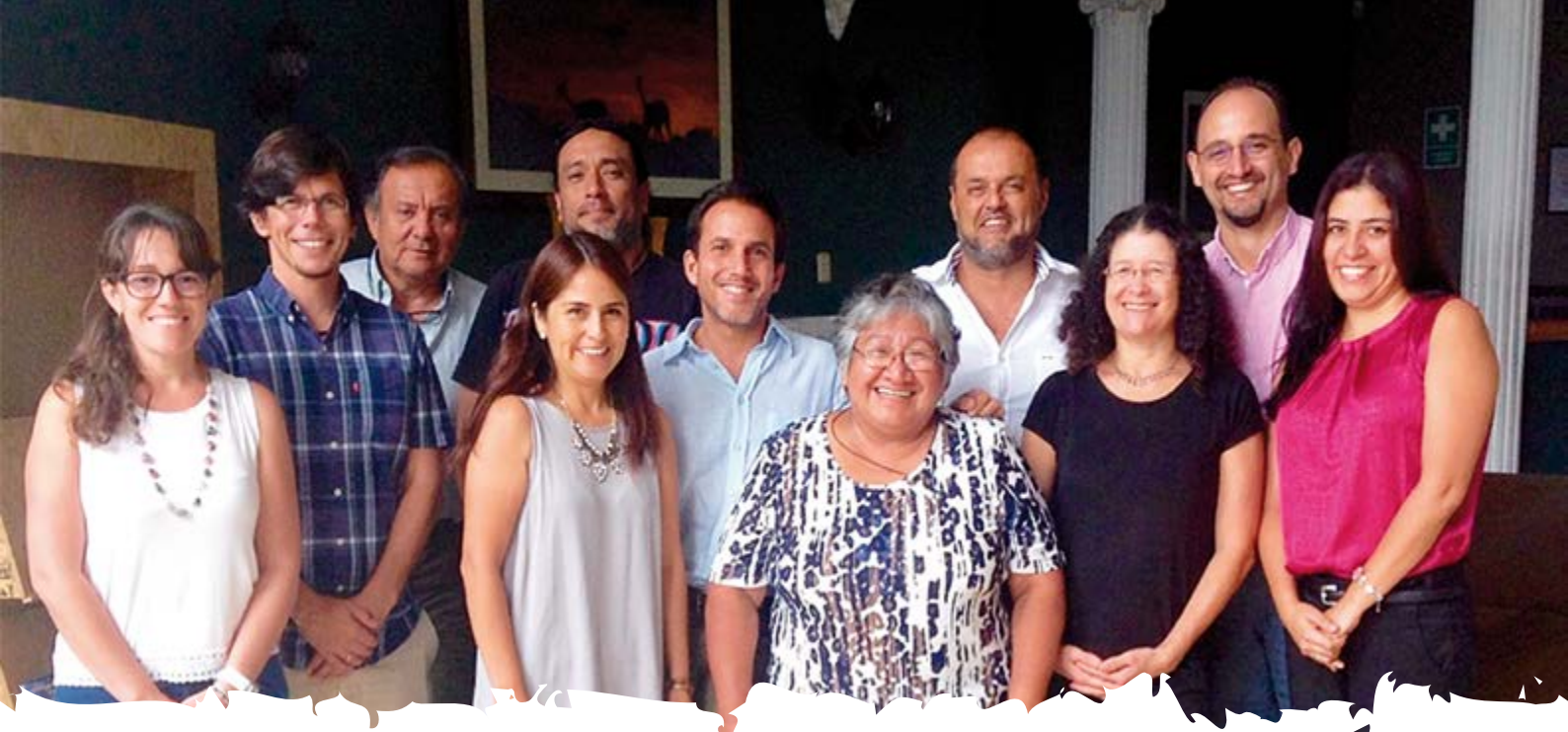
1ra Reunión del Comité Nacional de Revisión de Propuestas del Fondo de Alianzas para los Ecosistemas Críticos (CEPF) en Perú.