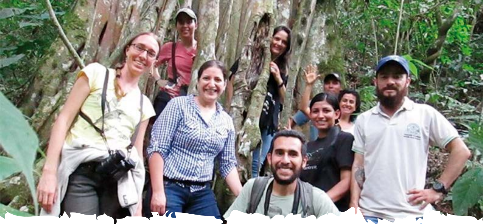
Socialización de los proyectos aprobados en el Cairo (Serraniagua, Colombia), 5 de agosto del 2016