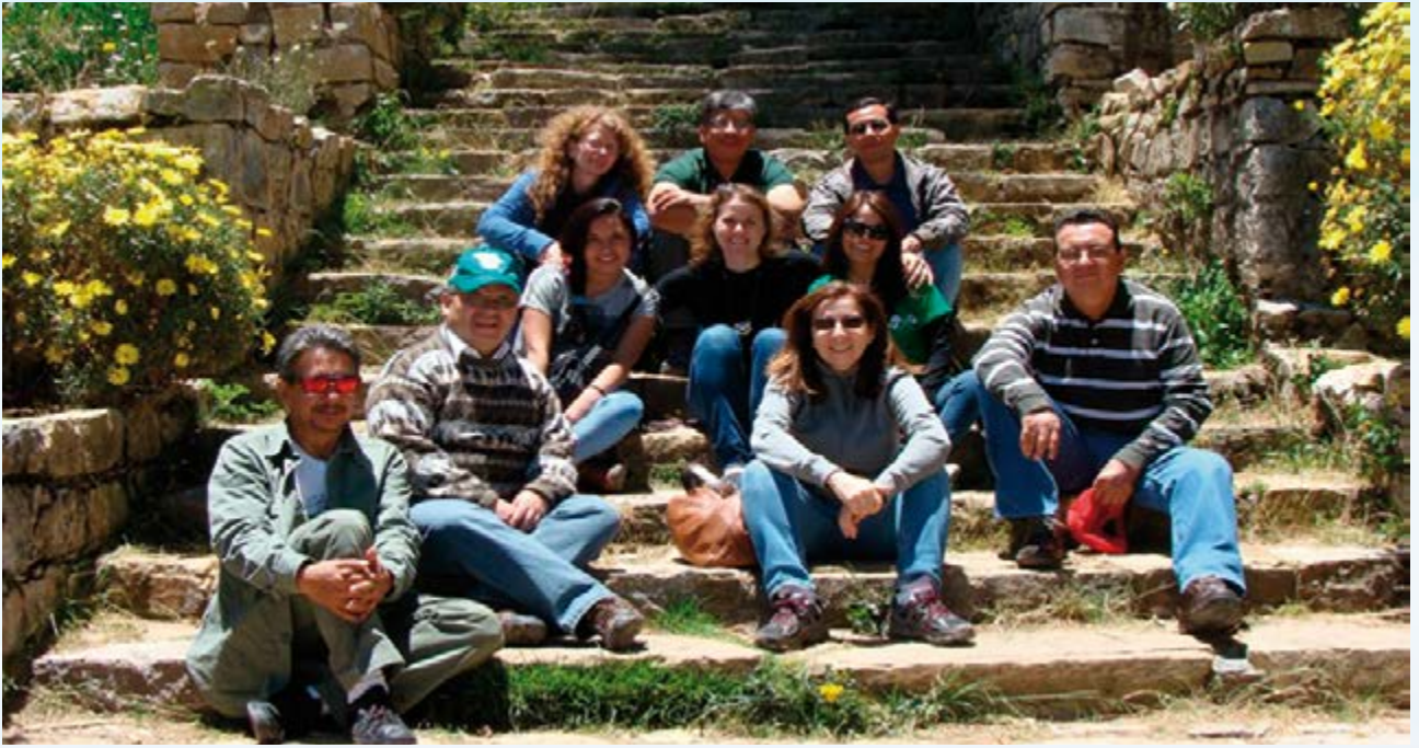
Capacitación RIT 2015, Isla del Sol, Bolivia.